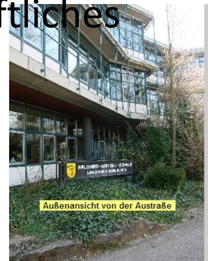
Außenansicht von der Austraße